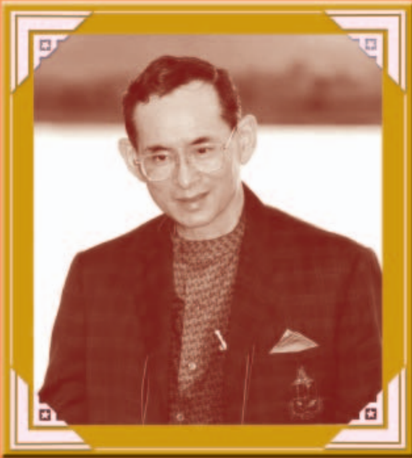
พระบรมราชาโชวาท ของ พระบาทสมเด็จพระเจ้าอยู่หัว ภูมิพลอดุลยเดชฯ ทรงพระราชทานแก่ข้าราชการพลเรือน เนื่องในวันข้าราชการพลเรือน ปีพุทธศักราช 2547

“ผู้ปฏิบัติราชการ จำเป็นต้องรู้วิทยาการ ฐานะ และรู้ดีรู้ชั่ว อย่างกระจ่างชัด จึงจะสามารถปฏิบัติบริหารงานในความ รับผิดชอบให้ถูกต้องตรงตามเป้าหมาย และสัมฤทธิ์ผลที่เป็น ประโยชน์เป็นความเจริญที่แท้จริงและยั่งยืน ทั้งแก่ตนเอง และส่วนรวม ”